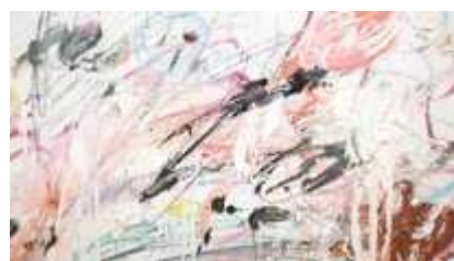
« Empire of flora »

Faire une recherche sur l'œuvre de Cy-Twombly .