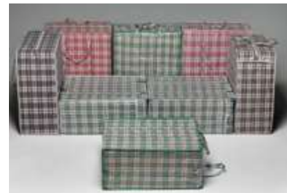
Le pouf digestion n°1

Faire comprendre ce qu'est le design en comparant différentes formes de bouteilles d'eau, de fourchettes etc..