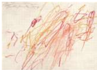
« Sans titre » Grottaferrata