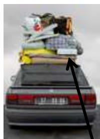
Le sac parmi les bagages