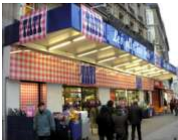
Tati à Barbès